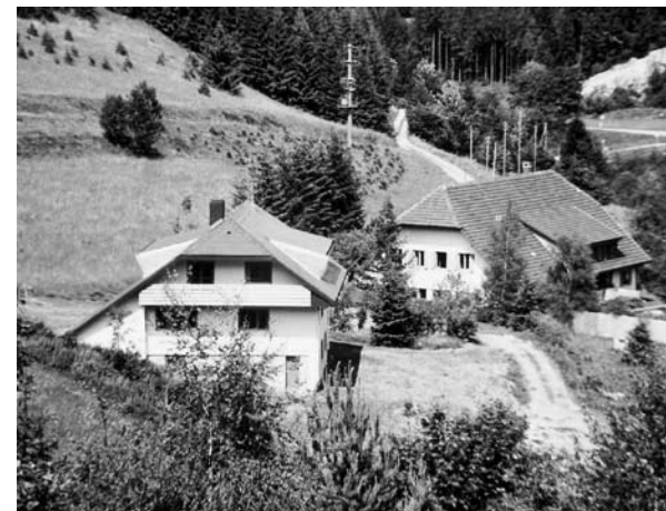
Abb. 3: Das fertiggestellte Laborgebäude (links) und das Institut 1974

1968 wurden aus Platzmangel im nahegelegenen Dorf Hogschür zusätzliche Laborräume für Tropfbildversuche angemietet und bis 1974 genutzt. Parallel dazu begann 1972 die Planung und der Bau des heutigen Laborgebäudes (Stutzhofweg 13), das 1974 fertiggestellt wurde.