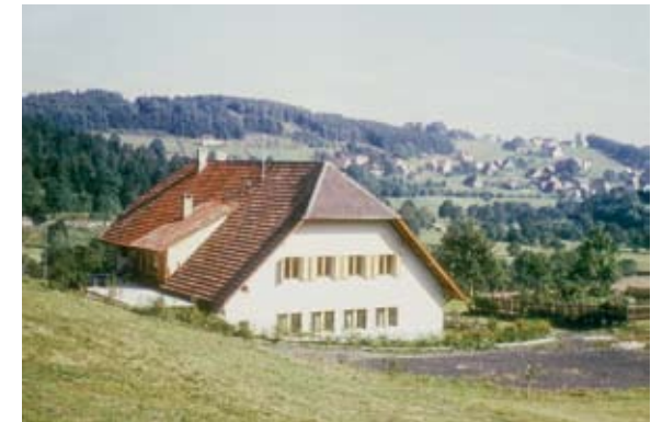
Abb. 2: Das neu erbaute Institut 1961

jeweils zwei Laboranten unterstützt, die jedoch selten länger als 2 Jahre im Institut verblieben.